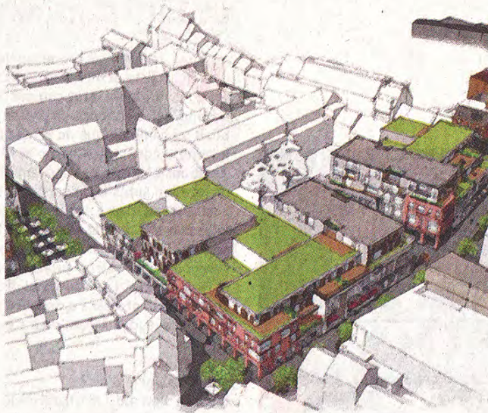
Matexi transformera notamment la galerie des Carmes. Sans oublier les parkings des Carabiniers et des Fontaines. © MATEXI.

On ne vous apprend rien : le commerce wavrien fait pâle figure face à L'Esplanade. Une course contre-la-montre est donc lancée par le promoteur immobilier Matexi. Il entend redynamiser le volet commercial de Wavre par le biais d'un important projet baptisé « La Promenade ». L'objectif est de le boucler avant l'extension programmée du centre commercial néolouvainiste, sous peine de se voir définitivement enterrer commercialement.